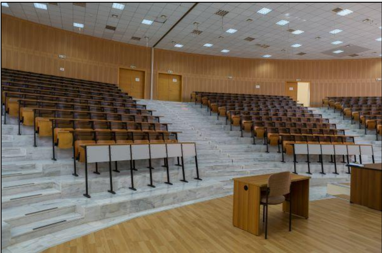
Κ.28 – Κεντρικό αμφιθέατρο κτιρίου Κ.28