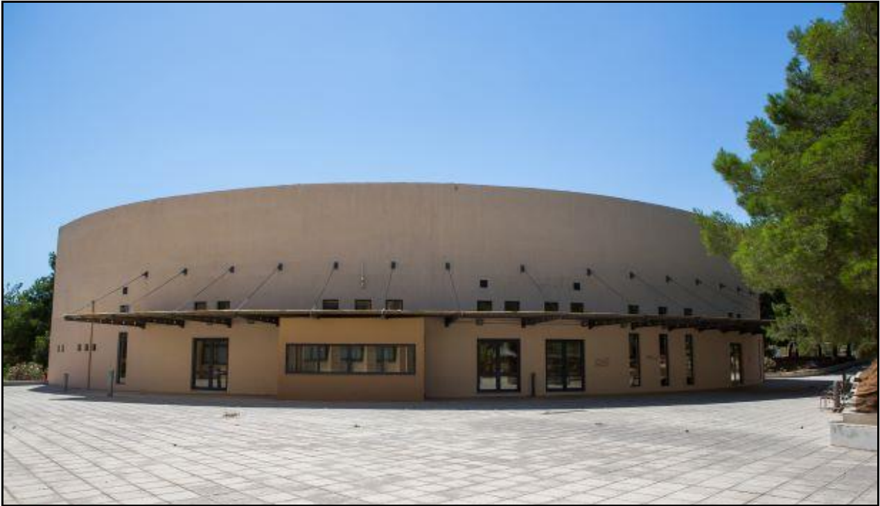
Κ.28- Εξωτερική άποψη – περιβάλλον χώρος