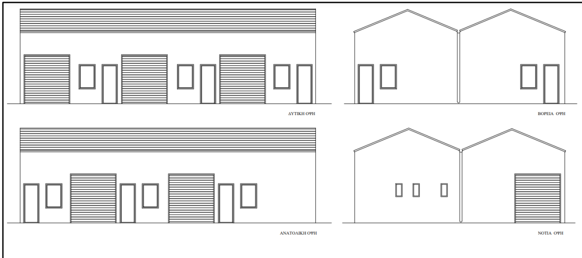
Σχήμα 2: Όψεις κατασκευής